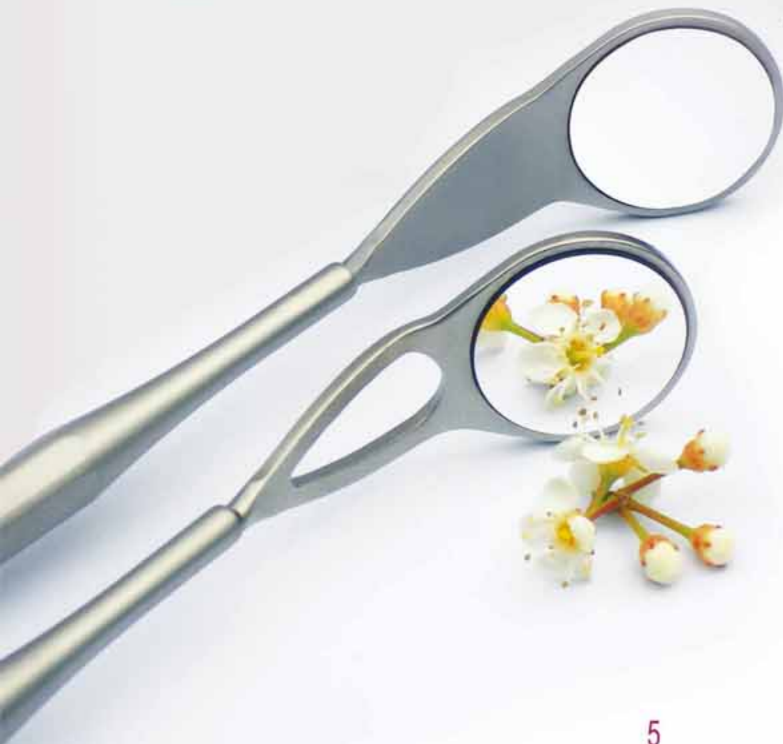
Odbicie względem aluminium